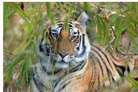
Национальный парк Бандхавгарх