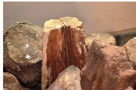
Национальный парк ископаемых растений