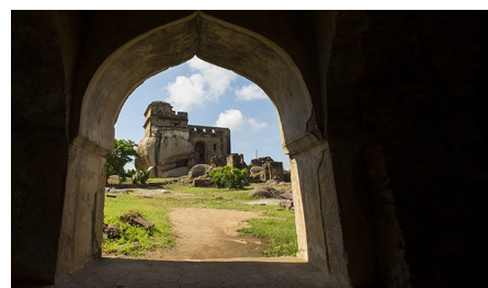
Форт Мадан -Махал